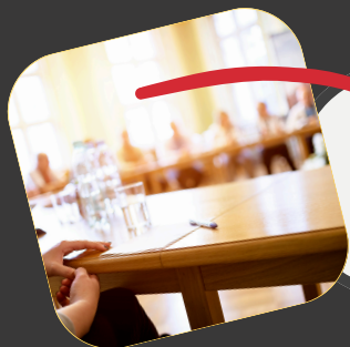
TABLE RONDE AVEC PLUSIEURS CONFÉRENCIERS POUR REPENDRE AUX QUESTIONS DES PARTICIPANTS (GRATUIT)